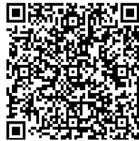
畢業資格審核查詢