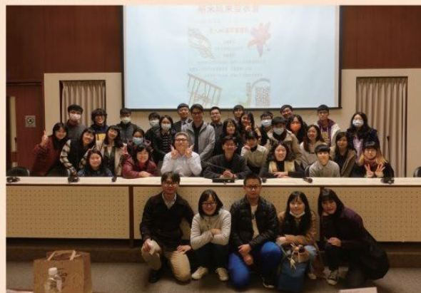
圖 / 法服專題成發

以上提到中原大學財經法律學系的課程規劃以及申請入學審查評量重點，希望能幫助同學了解本系的選才標準和對同學的期許。歡迎對法律有學習意願與熱忱的同學，加入我們這個大家庭！