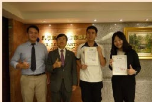
圖 / 永然聯合法律事務所實習

學校心理系的課程，近年備受社會矚目的精神障礙者減刑或是青少年犯罪議題都屬於這二者結合之領域，不同領域的連結遠比我們想像的更多；除此之外，語言是一項幾乎學必有所用的能力，多會一種語言就是多了一項溝通工具，如律師協助年長者打官司可能也會需要以台語進行溝通，我本於自身興趣修讀了校內的韓文課程，而調查局韓文組就可以作為我未來的選項之一，學校也有很多如日韓美荷等各國學校的交換資源，前往韓國交換本也是我的計畫之一，可惜因疫情而取消，但利用大學資源出國交換，加強語言能力之同時增廣見聞，絕對是值得放入大學待辦清單的項目。