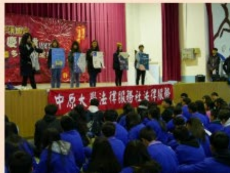
圖 / 中原大學法律服務社舉辦之營隊活動

全國專業倫理個案競賽「人工智慧(AI)應用於司法中之專業倫理」議題獲頒「特優獎」