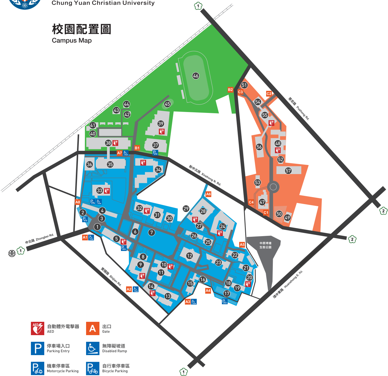
校園配置圖 Campus Map