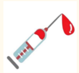
血液交換(共用針具)