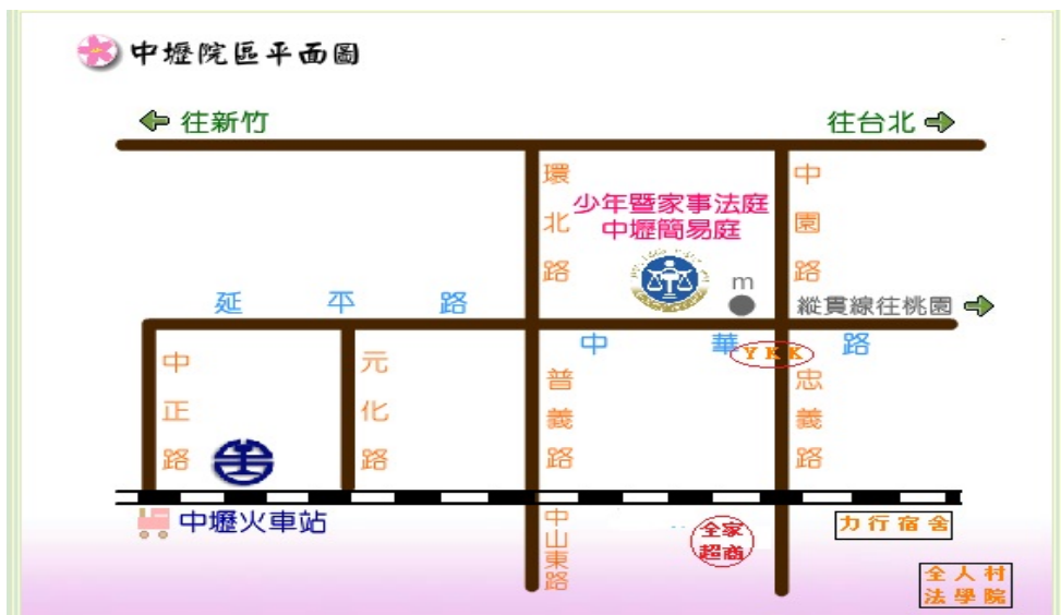
中壢簡易庭 簡式地圖